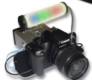
Fotocamera CANON con illuminatore a LED RGB