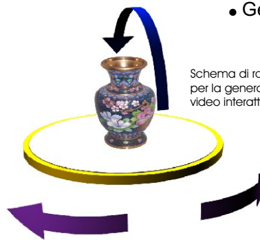
Schema di rotazione 3D per la generazione di video interattivi